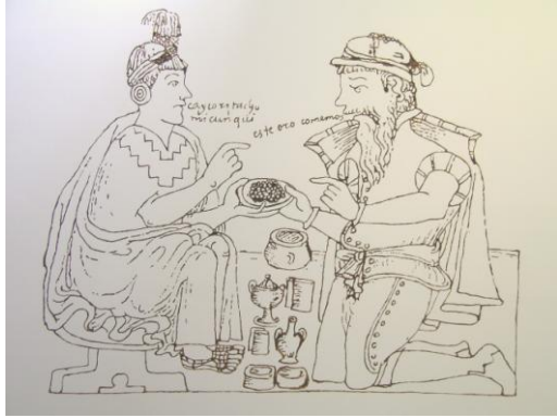
Estefanía Peñafiel Loaiza (Quito 1978) Une certaine idée du paradis 1. Este oro comemos (d'après Guamán Poma de Ayala) dessin mural, chocolat suisse, cacao équatorien, dimensions variables, 2006