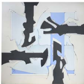
Mirage 1972 225 X 225 huile sur toile Collection de l'artiste