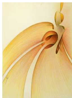
L'axe du temps 1960 130 X 97 cm huile sur toile Collection Pol Lambert, Bruxelles