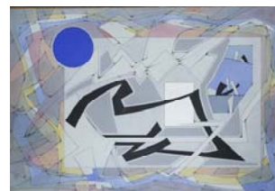
Eclipse 1992 130 X 195 acrylique sur toile Collection particulière