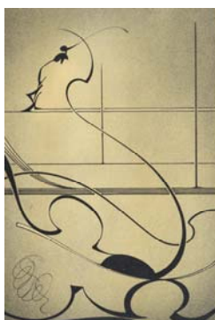
Etude 1998 33 x 22 cm technique mixte sur carton Arches marouflé sur bois Collection de l'artiste