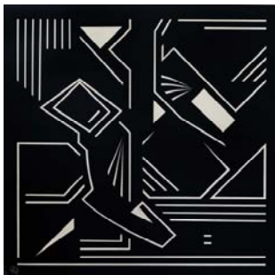
Rite linéaire 2011 150 X 150 cm acrylique sur toile Collection particulière