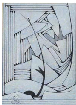
Etude 2004 29 X 21 cm encre et acrylique sur Arches marouflé sur bois Collection de l'artiste