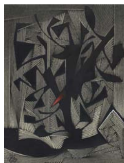
L'épine rouge 2015 41,5 x 33,5 cm acrylique sur carton Arches Collection particulière