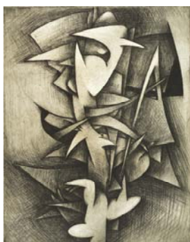
Cuba 1957 34,6 X 27,8 cm crayon, encre, encre de Chine et aquarelle sur papier Collection de l'artiste