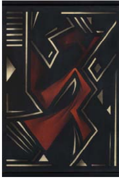
Automne disponible 2011 73 X 54 cm acrylique sur carton Arches marouflé sur bois Collection particulière