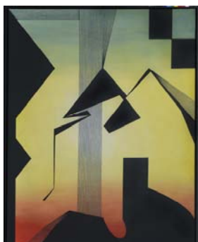
Crépuscule 2013 146 X 114 cm acrylique sur toile Collection particulière