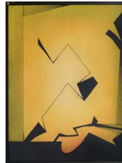
Les habitants de l'aube 2012 146 X 114 cm acrylique sur toile Collection particulière