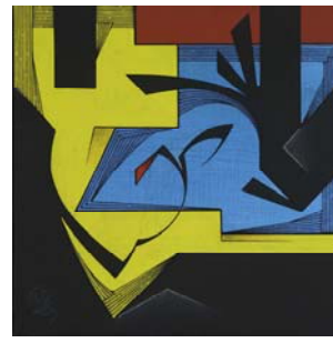
La fleur carnivore 2016 40 X 40 cm acrylique sur toile Collection particulière