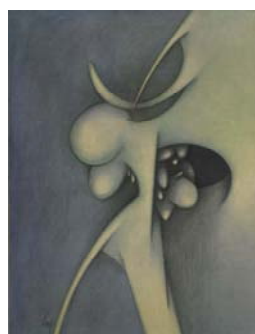
Le vide et la présence 1959 81 X 65 cm huile sur toile Collection particulière